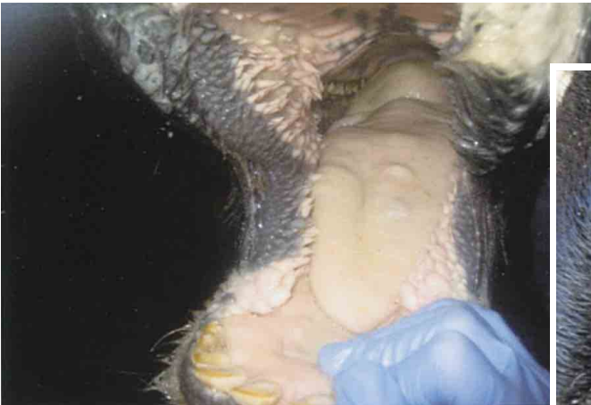
舌の水疱（ホルスタイン種）