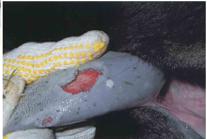
舌のびらん（黒毛和種）