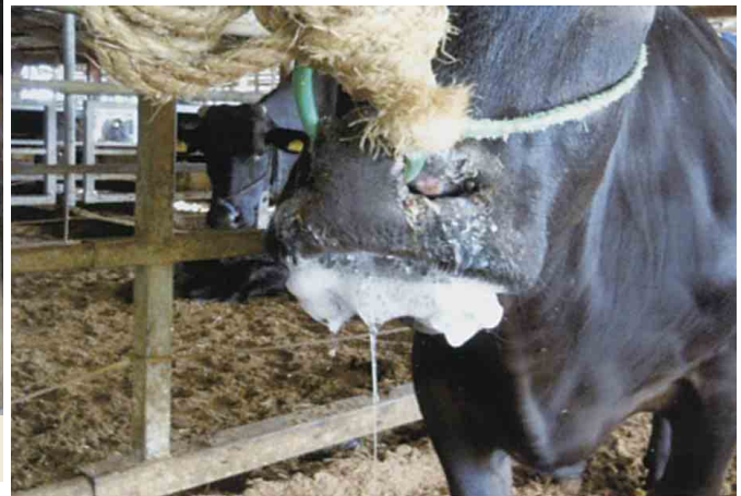
泡沫性流涎（黒毛和種）