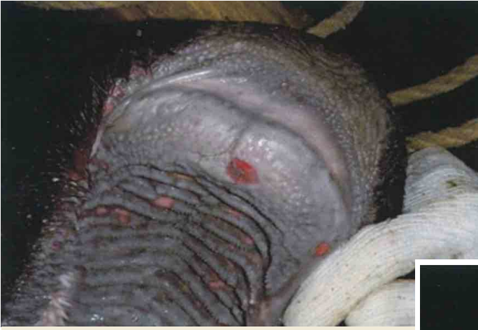
歯床板（口蓋）のびらん（黒毛和種）