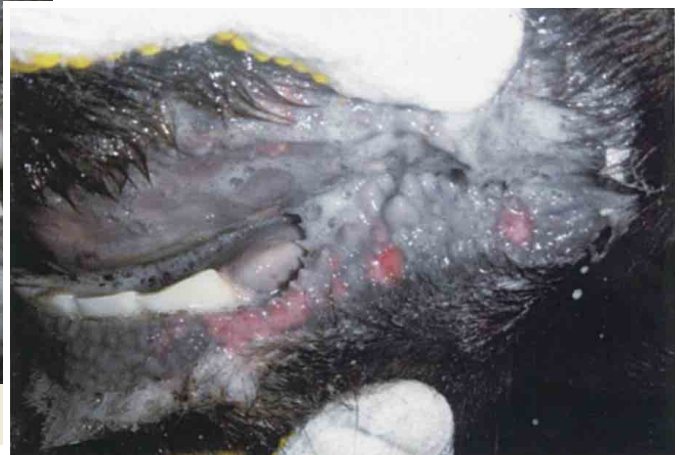
口唇部のびらん（黒毛和種）