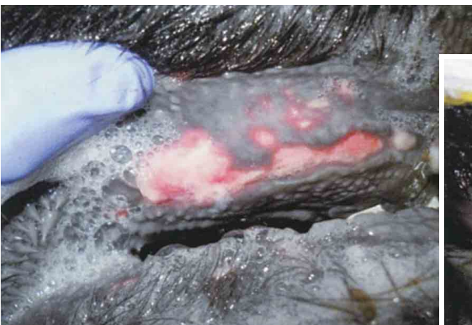
歯床部粘膜のびらん（黒毛和種）