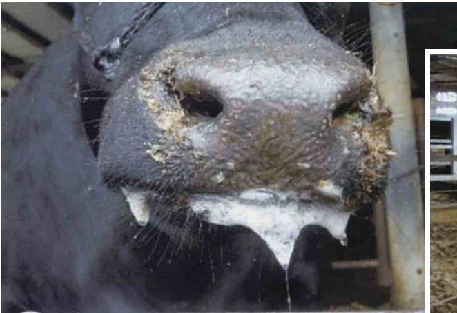
泡沫性流涎（黒毛和種）