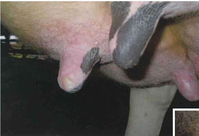
乳頭の水疱（ホルスタイン種）