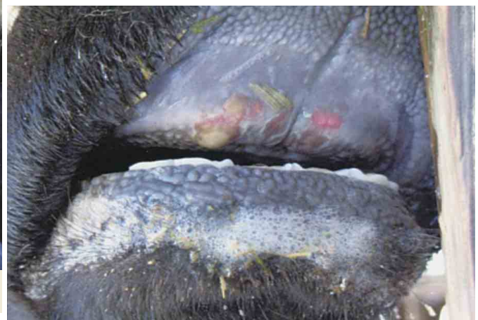
歯床部粘膜のびらん（黒毛和種）