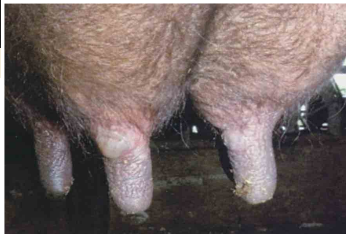
乳頭の水疱（黒毛和種）